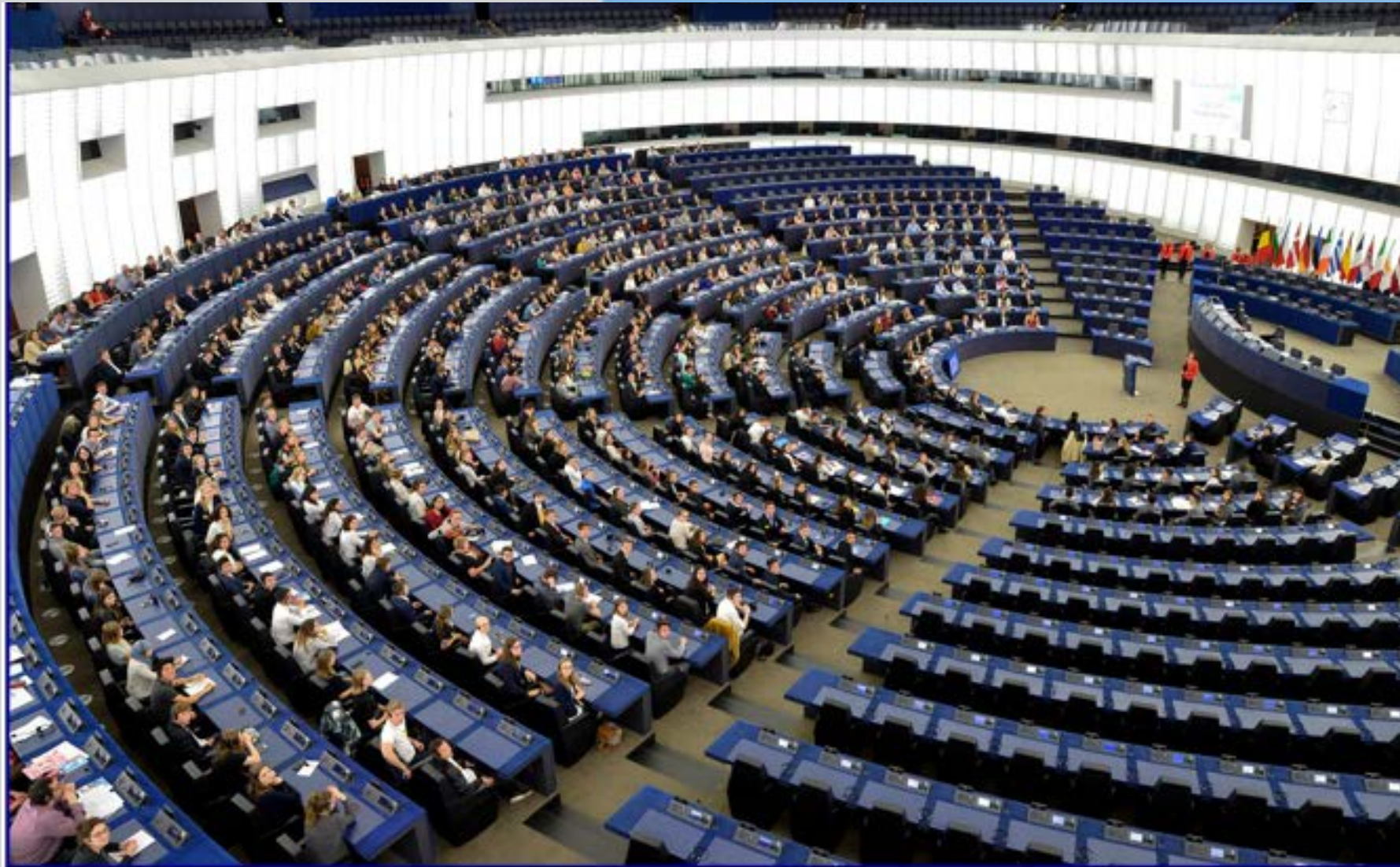
EUROSCOLA DU 21 MAI 2016 PARLEMENT EUROPÉEN DE STRASBOURG