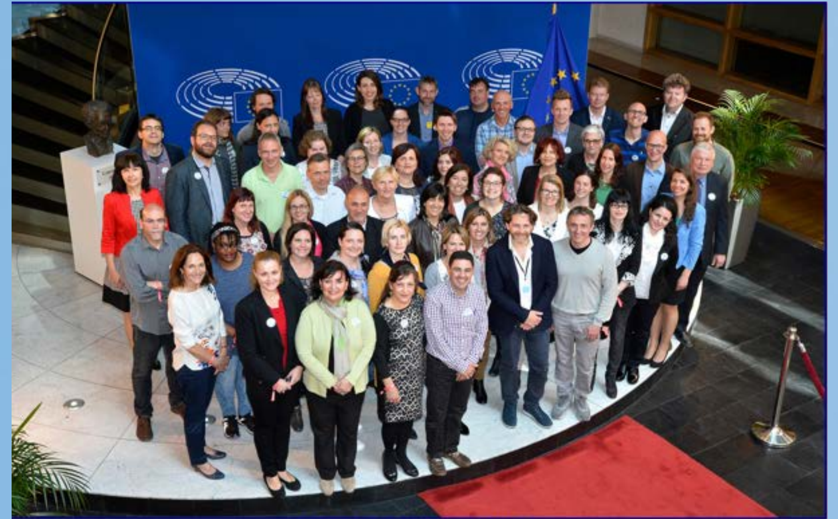
EUROSCOLA DU 21 MAI 2016 PARLEMENT EUROPÉEN DE STRASBOURG