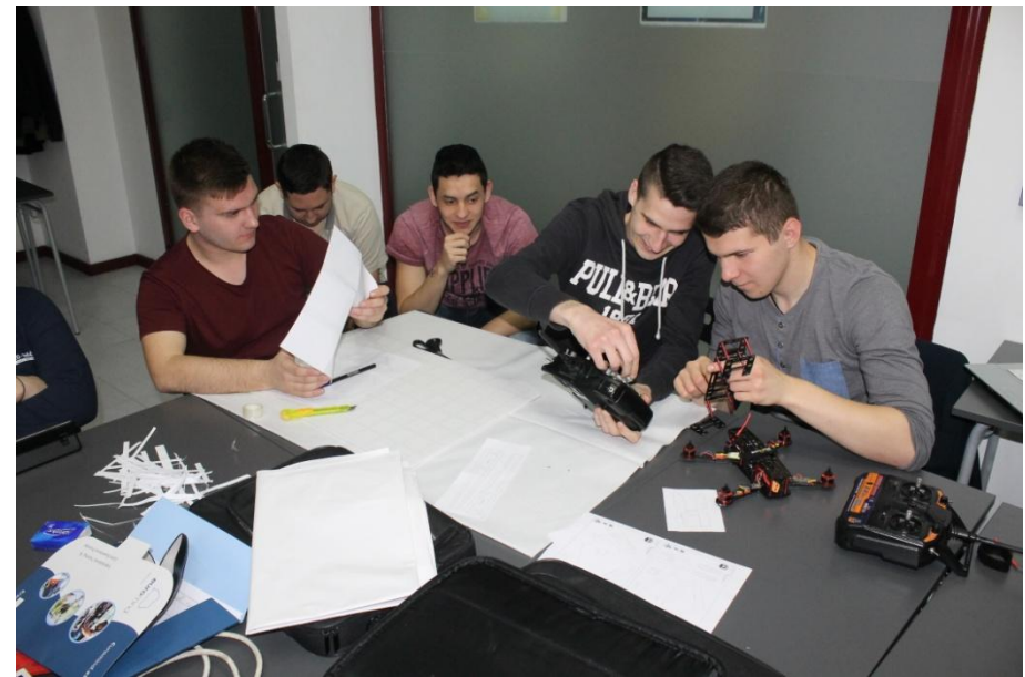
A ovako je bilo prošlih godina... Elektrotehničari u izradi dronova